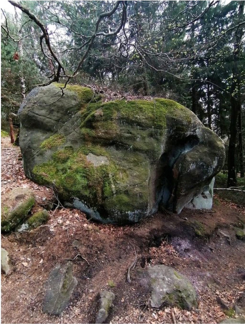
Obrázek č. 1/1