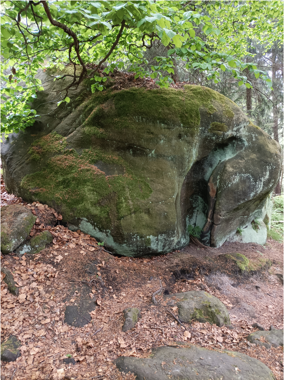
Obrázek č. 1/3