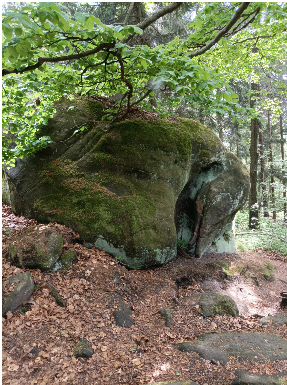
Obrázek č. 1/2