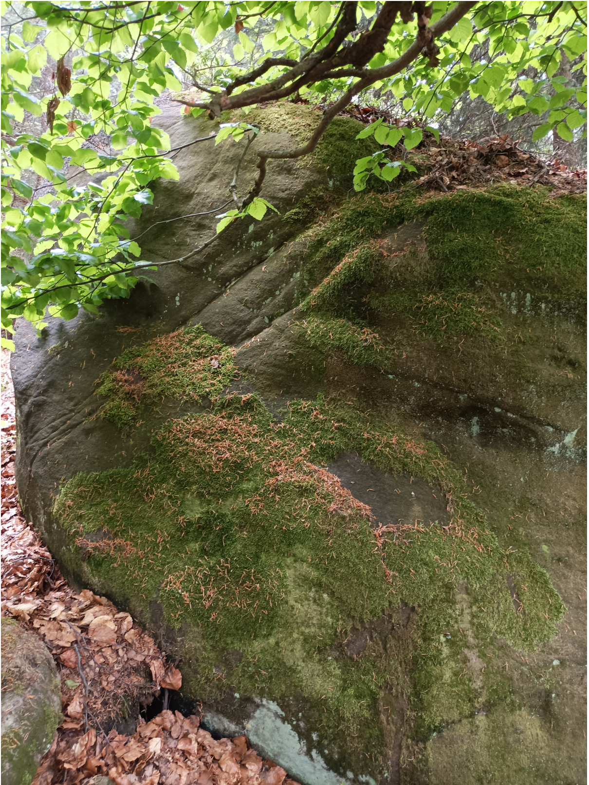
Obrázek č. 1/6