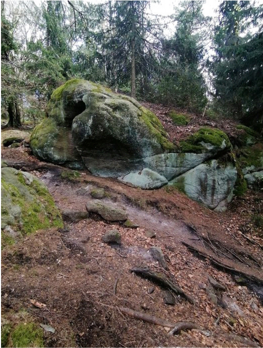
Obrázek č. 1/5