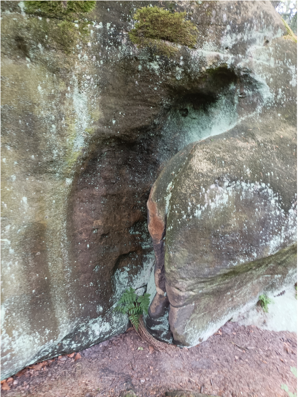
Obrázek č. 1/4